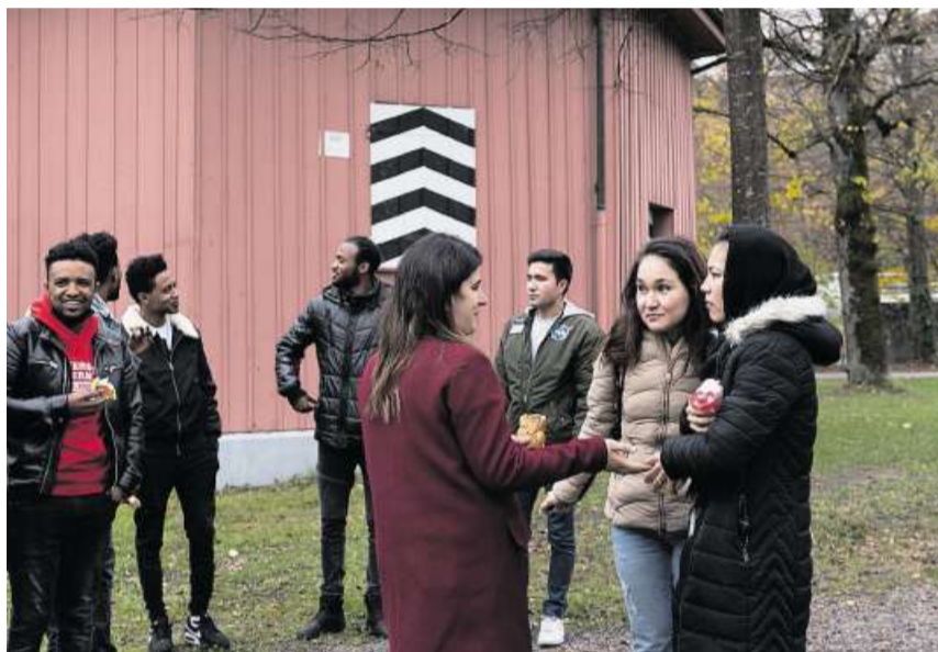
Die Integrationsklasse in einer Pause. Deutsch und Rechnen bereiten grosse Mühe.

«Ohne Vorlehre wäre ich in der Berufsschule wohl überfordert gewesen.»